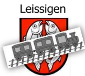
IG Leissigen Futura

Wir stehen weiter ein für das „Fischerdorf“ mit Bahnanschluss!