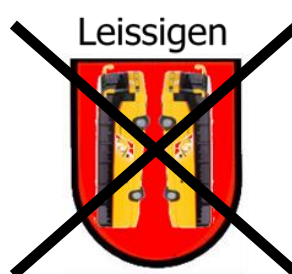
Leissigen, 16. Oktober 2018